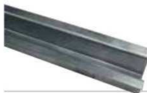
ACG5481 CANALETA DE TIERRA PARA CADENA L = 2 m