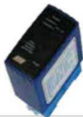
ACG9064 DETECTOR DE MASA MAGNÉTICO para apertura con auto-vehículos bicanal - 12÷24 Vca/cc