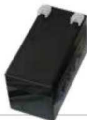
ACG9511 BATERÍA 1,2Ah 12V (ordenar 2 piezas para cada ACG5482)