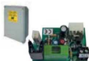
ACG5482 CARGADOR DE BATERÍAS STOPPER (necesidad de 2 piezas de ACG9511) con contenedor