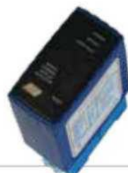
ACG9063 DETECTOR DE MASA MAGNÉTICO para apertura con auto-vehículos monocanal - 12÷24 Vca/cc