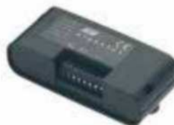
ACG5082 Receptor S433 1CH, monocanal, con bornera, con contenedor plástico Dim. 125x54x30